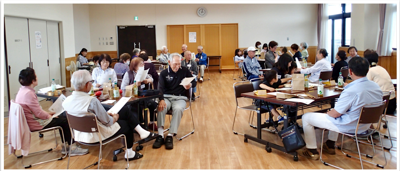
打楽器、輪唱などで3曲 「カエルの合唱」「めだかの学校」「かたつむり」